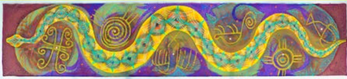
Pameri Yukesi, 2020 Acrílica sobre tela, 700x170cm