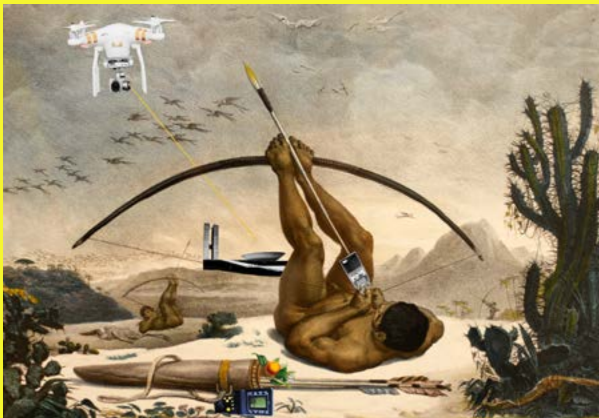
Atualizações Traumáticas de Debret, 2019/2021 Colagem digital, 42x29,7cm

Nesta colagem digital, a artista faz uma releitura anticolonial de uma obra do álbum “Viagem Pitoresca e Histórica ao Brasil” , criado pelo desenhista e pintor francês Jean-Baptiste Debret (1768-1848). Por meio de intervenções nas imagens, Gê Viana busca desconstruir o discurso colonial que traz corpos negros e indígenas como subalternizados e exotizados. Em sua obra, elementos arquitetônicos e dispositivos tecnológicos atuais reafirmam a existência indígena em meios urbanos e tempos contemporâneos. “Uso imagens que carregam traumas históricos do povo brasileiro, trazendo outras narrativas que trabalhem possibilidades mais felizes, pois sinto que nossa felicidade está em risco”, conta a artista.